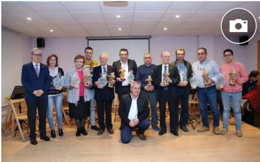
Foto de familia de los premiados por CGB Informática y el Ayuntamiento de San Cristóbal de Entreviñas.

La obra social de la empresa de informática de Aldeatejada entrega sus premios y galardona a El Norte por la difusión de su labor solidaria