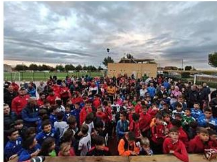
Medio millar de niños compiten en San Cristóbal a beneficio de la lucha contra el alzhéimer

Desde las 9 de la mañana y hasta las 20 horas de la tarde, este 21 de septiembre, se ha celebrado en el municipio de San Cristóbal de Entreviñas el V Trofeo de Fútbol 7 CGB "Por un futuro sin alzhéimer", organizado por la Obra Social de CGB Informática, por el Ayuntamiento de San Cristóbal de Entreviñas y Amigos Quintos del 66. El Torneo resultó un completo éxito de participación y asistencia, con más de 514 niños que compitieron animados por unas gradas repletas de 4.362 personas. Todo lo recaudado en el torneo se destinará a la Asociación de Enfermos y Familiares de alzhéimer. A lo largo del campeonato hubo música, ludoteca para los más pequeños, comida y