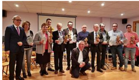
Foto de familia de todos los premiados tras finalizar el acto en el

El evento, al que acudió su subdelegado del Gobierno en Zamora, Ángel Blanco, se inició con el recibimiento por parte de los Minions a los niños de San Cristóbal de Entreviñas, a la que sucedió la recepción de la Corporación Municipal a los premiados. Acompañados de una fanfarria, se trasladaron desde el Consistorio hasta el Centro de Día donde tuvo lugar la entrega de premios.