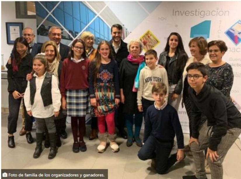
Foto de familia de los organizadores y ganadores.